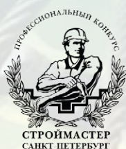
«Лучшая бригада» и «Лучший по профессии» октябрь