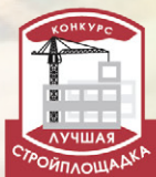
«Лучшая строительная площадка и бытовой городок» ноябрь