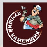
«Лучший каменщик» май